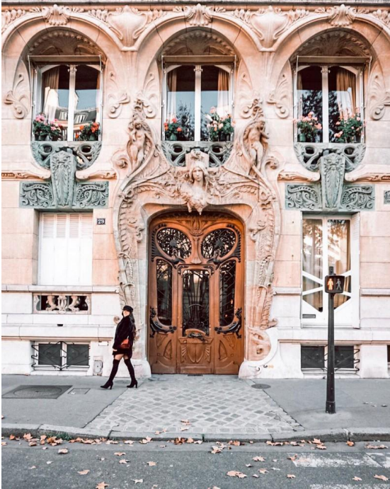
La curieuse et fantaisiste porte du 29 Avenue Rapp.